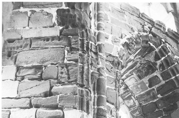
9. Mettlach, »Alter Turm«. Steinzerfall innen (vor der Sanierung).

Vor den eigentlichen Sanierungsmaßnahmen waren zunächst mehrere naturwissenschaftliche Voruntersuchungen und begleitende Bauforschung und Schadensuntersuchungen durchzuführen, deren Ergebnisse Grundlage für die Strategie der nachfolgenden Sanierung sein sollten. So untersuchte das Institut für Gebäudeanalyse und Sanierungsplanung (IGS) in München die Feuchtigkeits- und Salzbelastung im unteren Mauerwerk bis zur Unterkante der Fenster, indem 18 Kernbohrungen und 18 Oberflächenproben analysiert wurden. Dabei wurde festgestellt, daß eine deutlich erhöhte Durchfeuchtung auszumachen ist, die bodennah besonders hoch war. Eine ebenfalls anormal hohe Versalzung des Mauerwerks, besonders durch Nitrat und Chlorid, konnte darüber hinaus beobachtet werden, wobei eine Konzentrationszunahme umgekehrt verlief, die Belastung war bodennah geringer als in höheren Zonen. Als durchaus kritisch wurde die Feuchtigkeits- und die Nitratbelastung angesehen, letztere möglicherweise auch durch den dichten Bewuchs hervorgerufen. Das Institut für Bauforschung der RWTH Aachen (IBAC) führte Mörteluntersuchungen mit chemisch-mineralogischen Analysen durch,