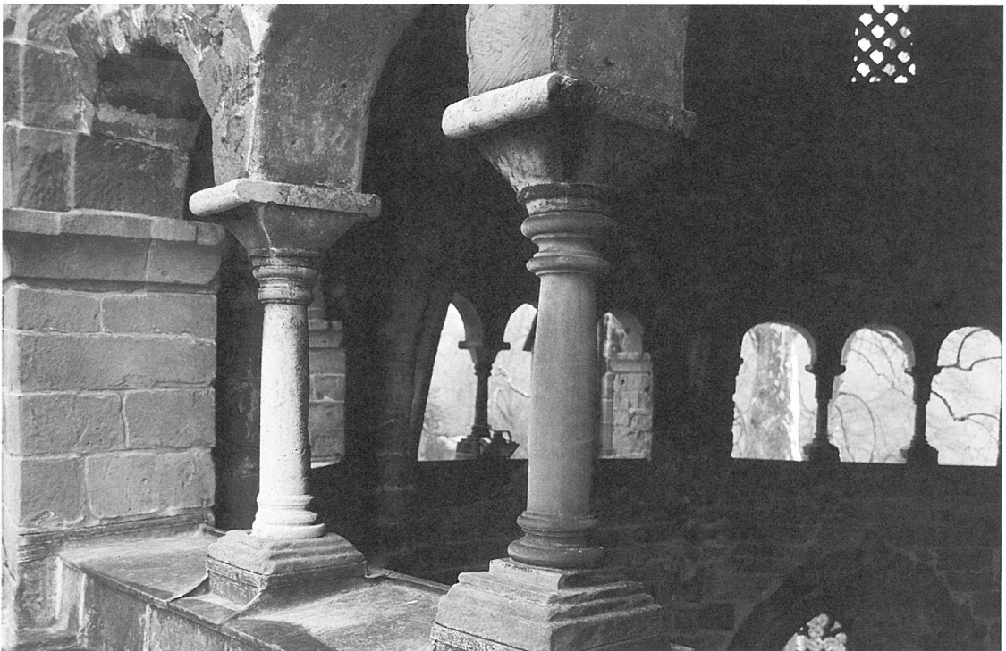
6. Mettlach, »Alter Turm«. Kapitelle, Umgang Nordwest.