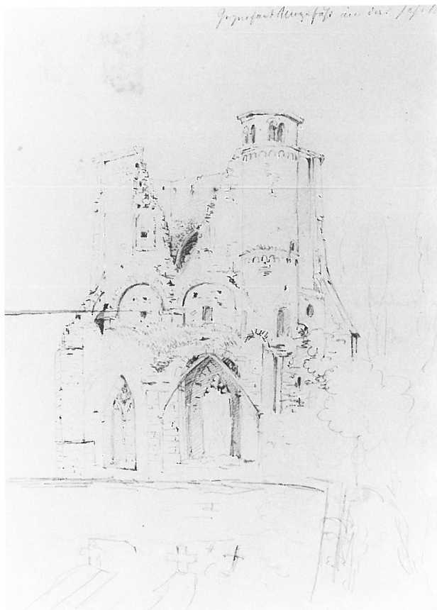
8. Mettlach, »Alter Turm«. Ruinenzustand 1830, Handzeichnung Eugen Boch.

üppigen aber flächigen Muster lassen an Freistellen den Hintergrundkern durchschimmern. Die Forschung hat bisher weder für Mettlach noch für Trier überzeugende Erklärungen finden können, die Singularität der Form für das 10. Jahrhundert wird stets herausgestellt 19 . Somit stehen noch Überlegungen zur möglichen Provenienz der Formen aus. Hier scheint sich ein Blick in den byzantinischen Kulturkreis aufzudrängen. In Konstantinopel hält sich vom 6. bis zum 11. Jahrhundert eine besondere Art der Kapitellproduktion, die eine stilisierte Verhärtung von vegetabilischem Dekor zeigt. Dabei fällt auf, daß die immer scharf geschnittenen üppigen Muster vielfache Verschlingungen aufweisen und stets eine Zweischichtigkeit besitzen, bei der das flächig aufgelegte Dekor den darunter gleichmäßig durchgehenden Untergrund durchschimmern läßt 20 . Die Anwendung von Kämpferkapitellen allein ist bereits eine auffallende Parallele zwischen Byzanz und Mettlach, ebenso wie die merkwürdige weite Ausladung der eigentlichen Kämp-