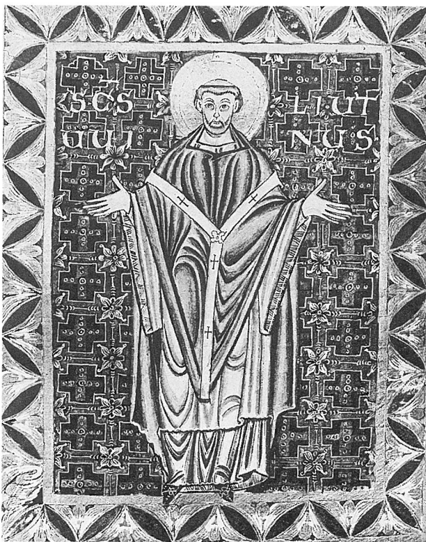
3. Cividale, Museo civico. Egbert-Psalter, Darstellung des Mettlacher Klostergründers Liutwin.

Trotz der bekannten künstlerischen Leistungen im Trierer Raum unter Erzbischof Egbert wurde diesem lange keine besondere Bautätigkeit zugestanden. Vor einiger Zeit erst konnten neue Erkenntnisse gewonnen werden, die klar machen, daß die große Bautätigkeit am Trierer Dom, die bisher allein Erzbischof Poppo (1016–1047) zugewiesen wurde, schon unter Egbert im Jahr 989 (dendrochronologisches Datum) begonnen hatte. Er plante und begann einen umfassenden Domumbau. Die Auffassung setzt sich allmählich