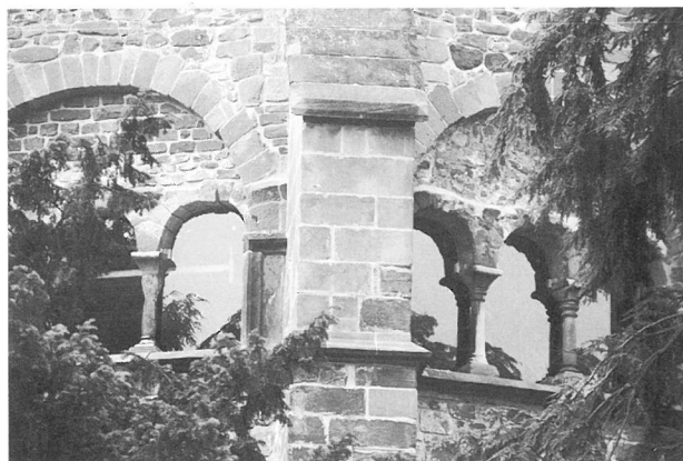
12. Mettlach, »Alter Turm«. Musterverglasung.