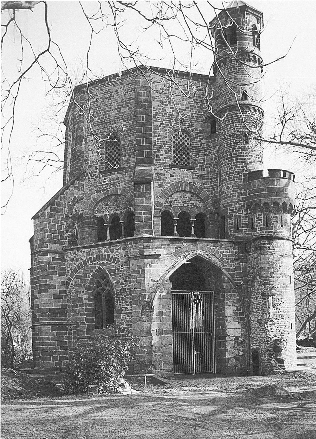
4. Mettlach, »Alter Turm«. Zustand 1998.