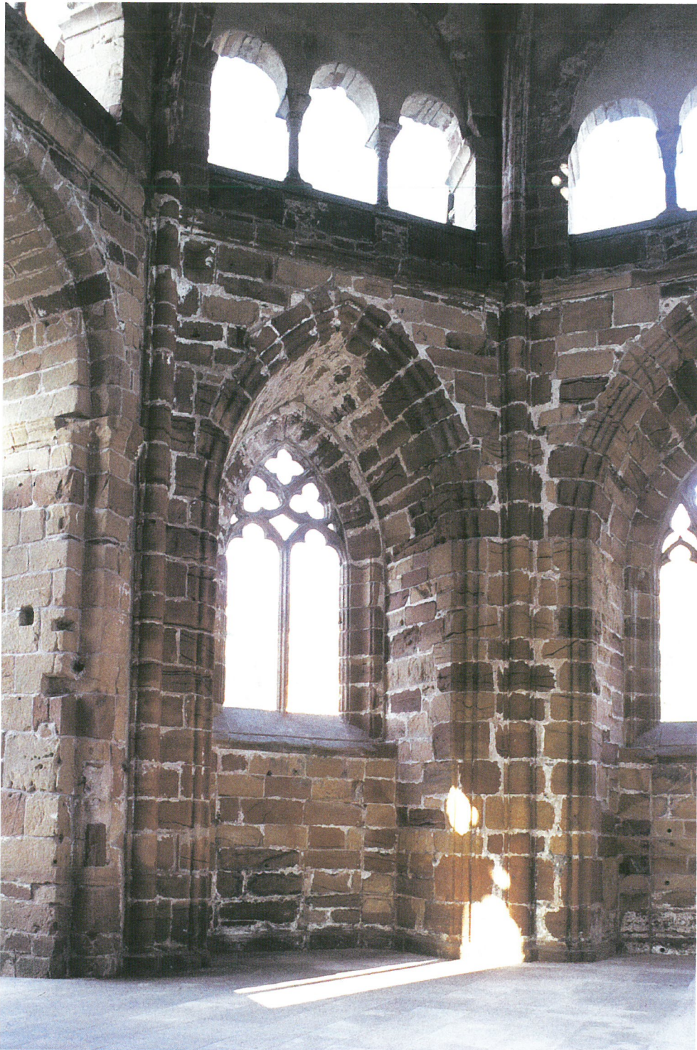
7. Mettlach, »Alter Turm«. Innenansicht 1998.