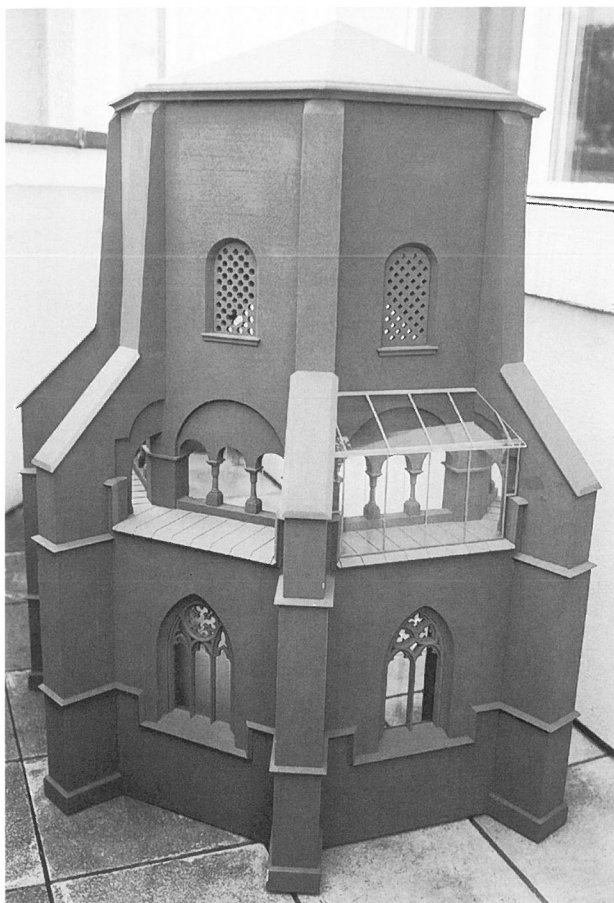
11. Mettlach, »Alter Turm«. Modell mit Glasumgang.

das Außenmauerwerk von Bewuchs (Efeu) befreit und entwurzelt worden war. Eine intensive Untersuchung des Mauerwerks schloß sich an, wobei stark geschädigte Steine gegen geeignete Ersatzsteine ausgetauscht wurden. Die gesamten Sandsteinarbeiten wurden unter ständiger Kontrolle von Architekt und Denkmalpflege von der elsässischen Firma Rauscher durchgeführt. Eine neue Verfugung des Außenmauerwerks schloß diese Arbeiten ab. 1995 begann die Innensanierung, die nach dem gleichen Schema verlief, wobei hier jedoch noch zurückhaltender Steinersatz betrieben wurde. Die zahlreich vorhandenen Putzreste wurden dokumentiert und bauhistorisch untersucht. Ziel war es, möglichst viel an originaler Substanz zu bewahren. So wurden lose Putzteile – auch die des 19. Jahrhunderts – nicht abgeschlagen und erneuert, sondern wieder gefestigt. Kleine Fehlstellen wurden mit gleichem Putz geschlossen, größere wurden belassen und lediglich die Ränder zur Festigung beigeputzt.