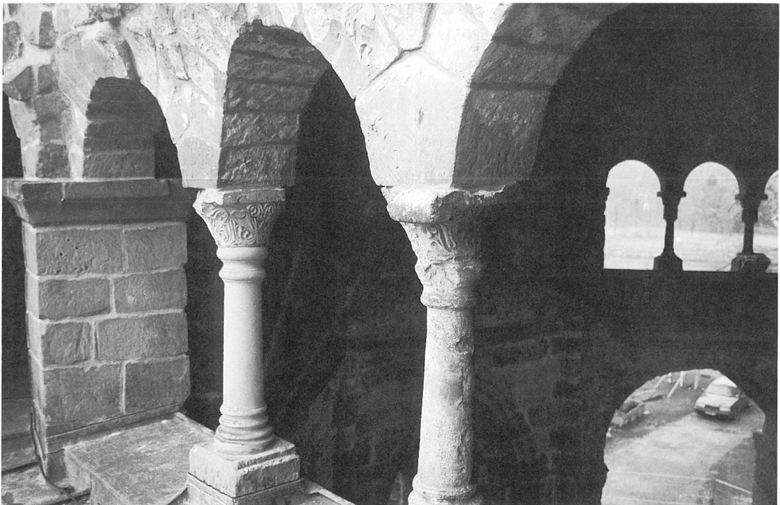
5. Mettlach, »Alter Turm«. Kapitelle, Umgang Südost.