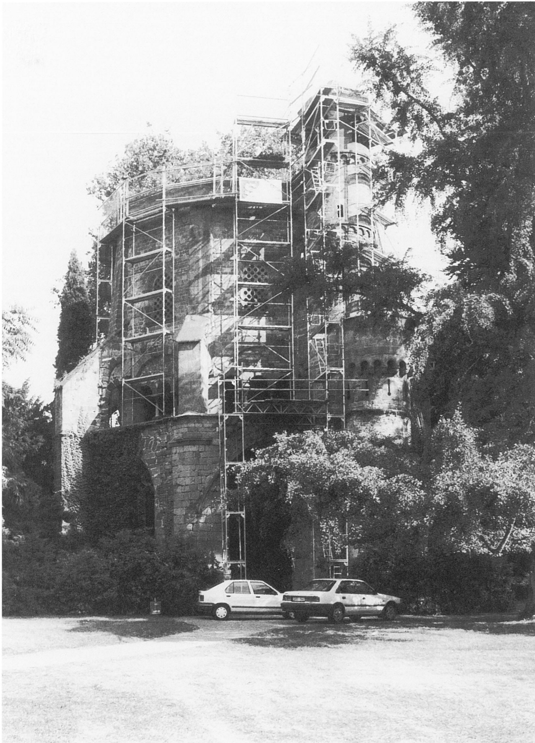
2. Mettlach, »Alter Turm«. Bei Beginn der Sanierung.